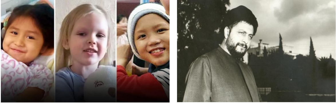
عملية احتيال عالمية تستغل الأطفال المصابين بالسرطان