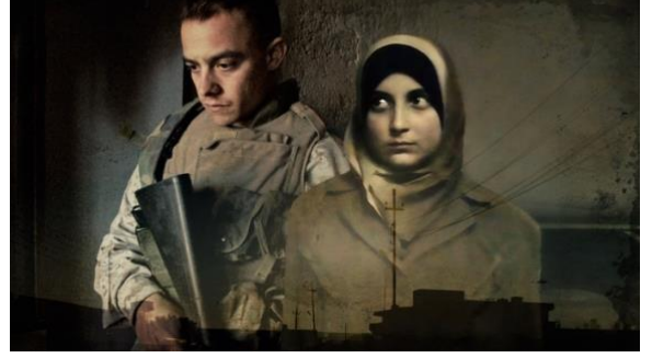
مجزرة حديثة ومشاة البحرية الأمريكية الذين أفلتوا من المحاسبة أطفال سورية المسروقون